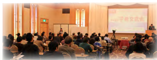
第17回学術交流会の様子